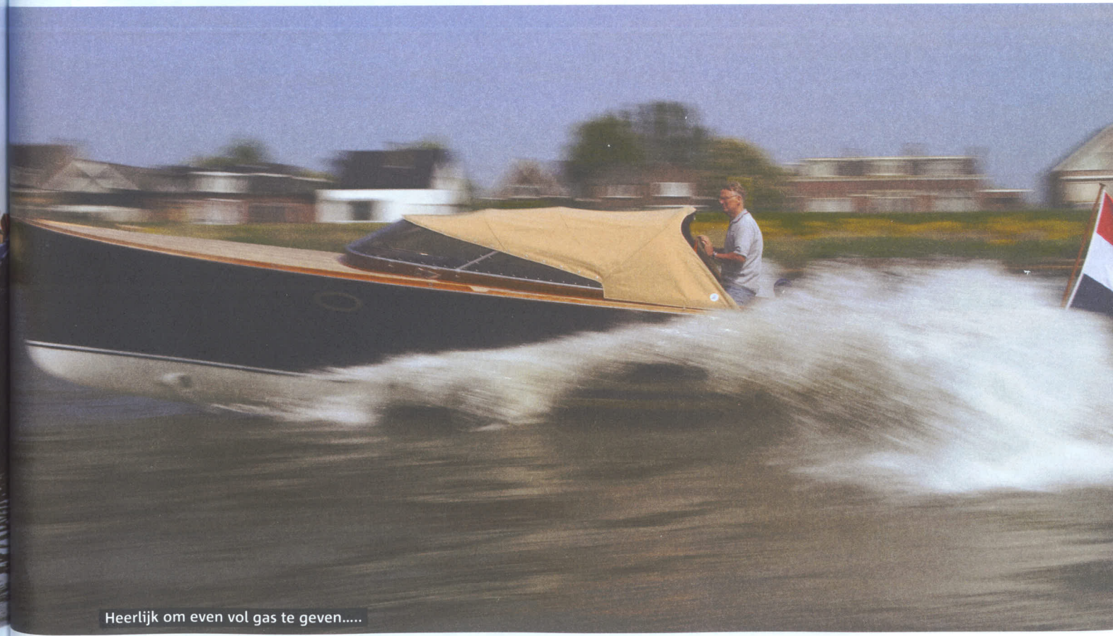
Heerlijk om even vol gas te geven.....