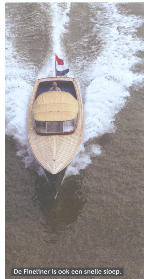
De Fineliner is ook een snelle sloep.

Wat als eerste opvalt bij het zien van de Fineliner 33 is de slanke vormgeving. Het is absoluut geen doorsneesloep. De hoge boorden en de slankheid van de boot geven hem een luxe designuitstraling. Maar die slankheid en het lichtere gewicht bieden de Fineliner 33 ook het functionele voordeel dat de boot gemakkelijk trailerbaar is.