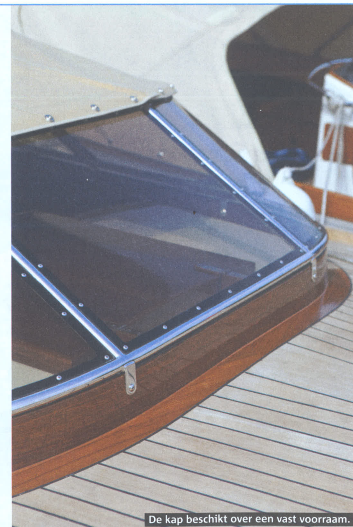
De kap beschikt over een vast voorraam.