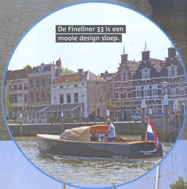
De Fineliner 33 is een mooie design sloep.