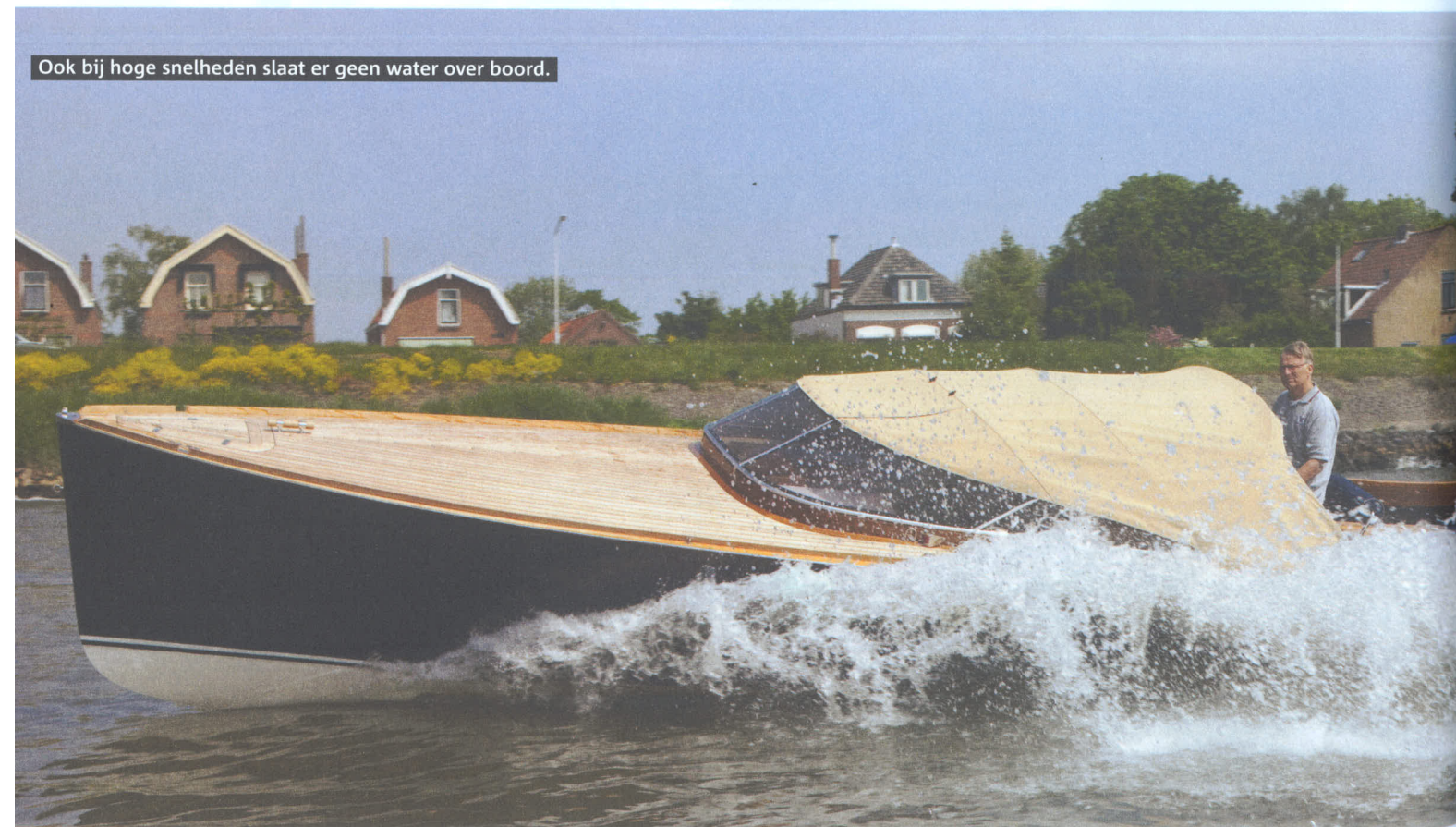
Ook bij hoge snelheden slaat er geen water over boord.