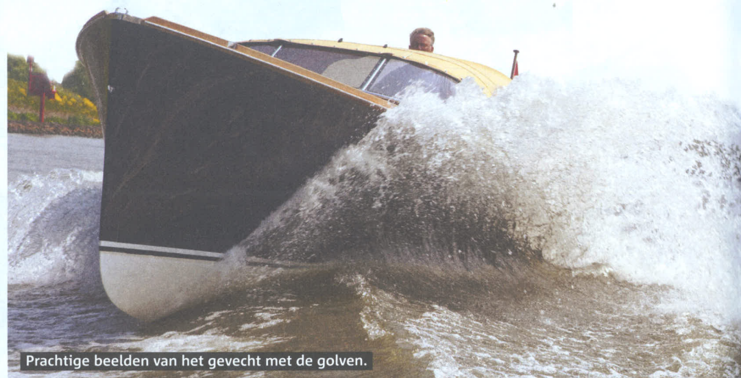
Prachtige beelden van het gevecht met de golven.

De Fineliner komt van een Nederlandse werf. Ontworpen in Nederland en naar Nederlandse kwaliteitmaatstaven gebouwd in Thailand. Een initiatief dat als opleidings- en werkgelegenheidsproject financieel wordt gesteund