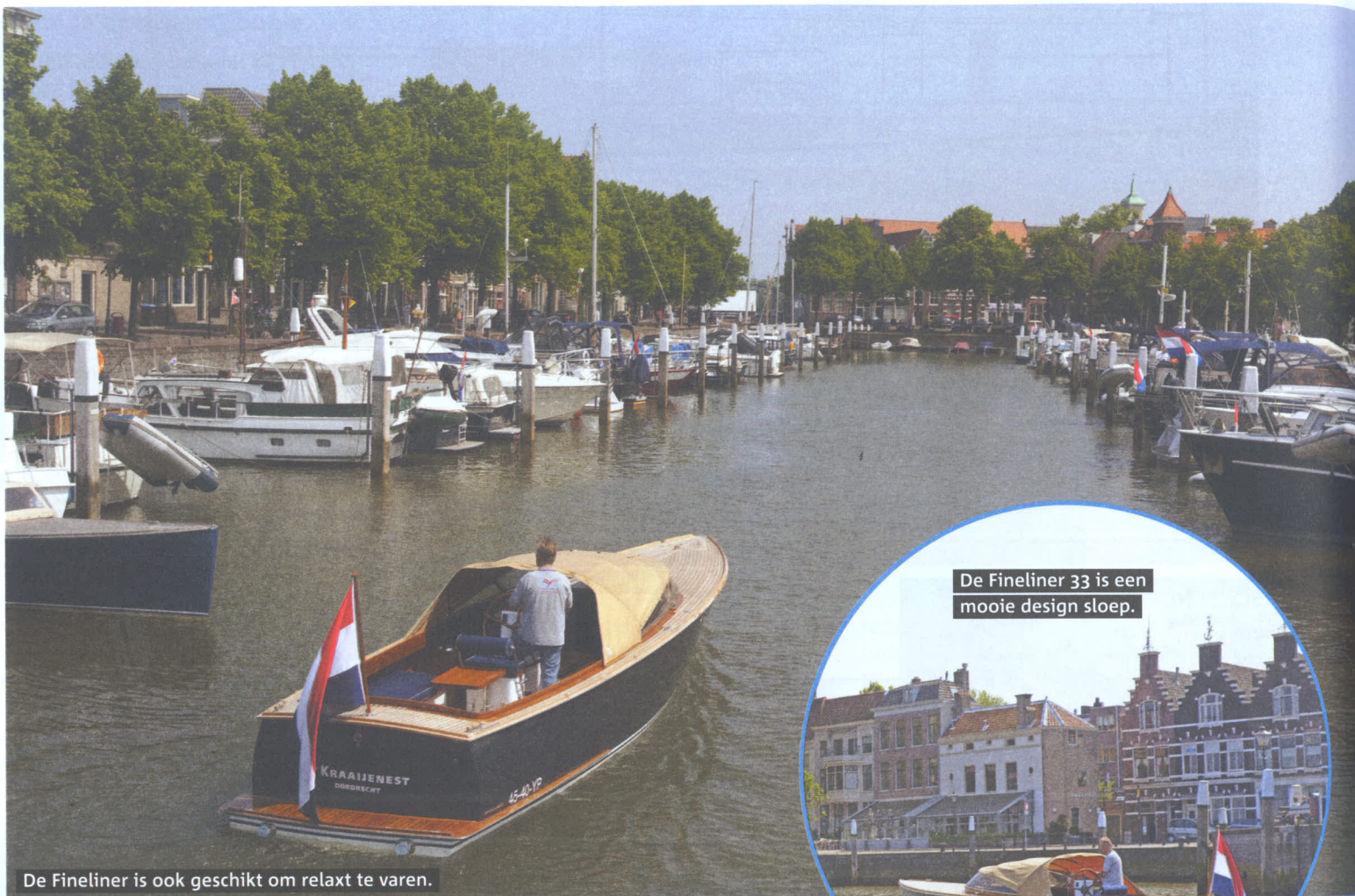
De Fineliner is ook geschikt om relaxt te varen.