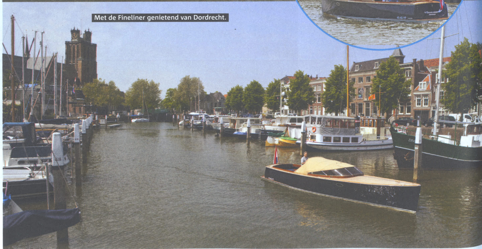
Met de Fineliner genietend van Dordrecht.