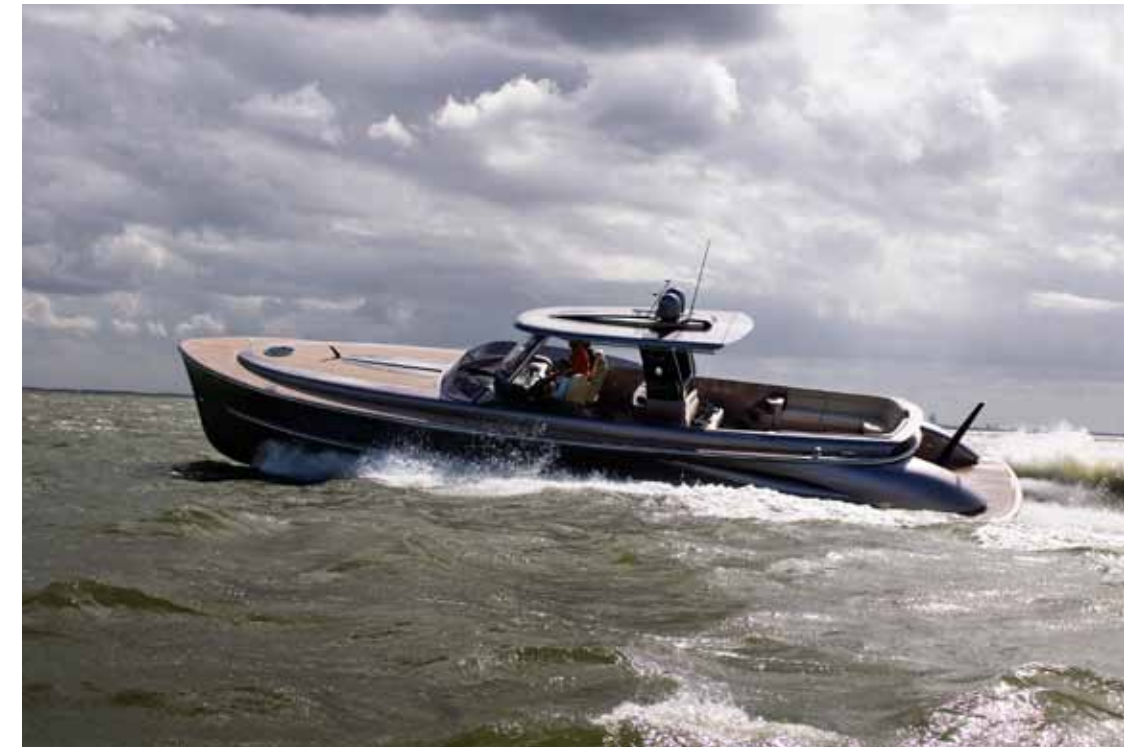
De eerste Q52 beschikt over Zeus met twee Cummins 600 pk's

Terwijl de Q52 de sluis van IJmuiden indraait, op weg naar de marina, waar het schip tijdens de Hiswa te Water de show zal gaan stelen, is het tijd voor conclusies. Het is moeilijk om deze boot onder een noemer te vangen, simpelweg omdat er nauwelijks vergelijkingsmateriaal voor handen is. Dit soort unieke projecten loopt wel eens slecht af, omdat er wordt bezuinigd op materiaal of vaarkwaliteiten. Zo niet bij de Q52. De kwaliteit van de romp overtuigde ons bij een windkracht waarop de meeste mensen aan de kant zouden blijven en de combinatie met Zeus levert een enorm vaargemak op. Verder