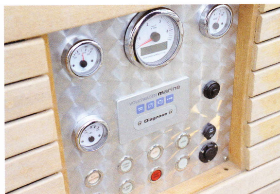
Het instrumentenspaneel in de zijkant van de boot.