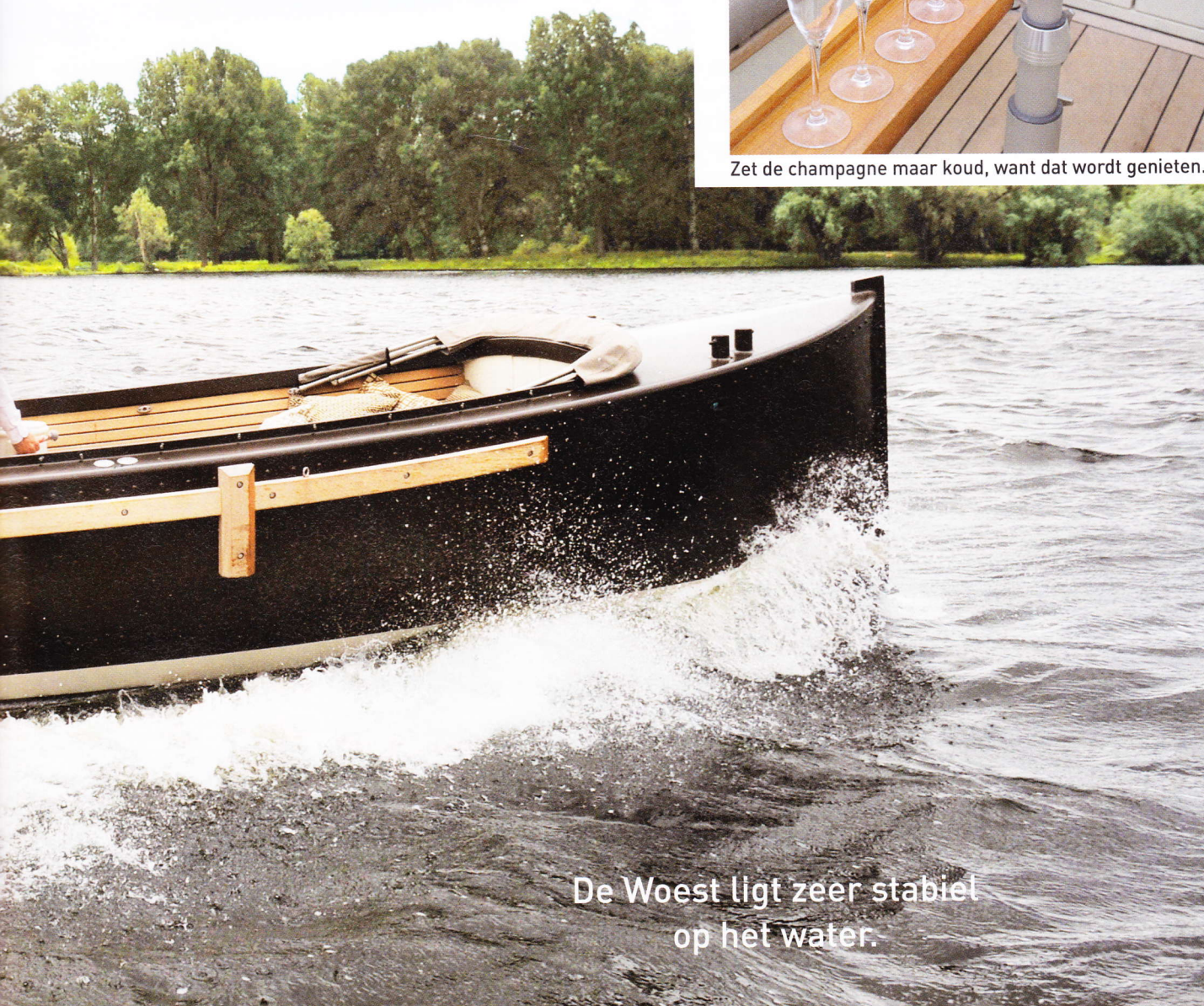
De Woest ligt zeer stabiel op het water.