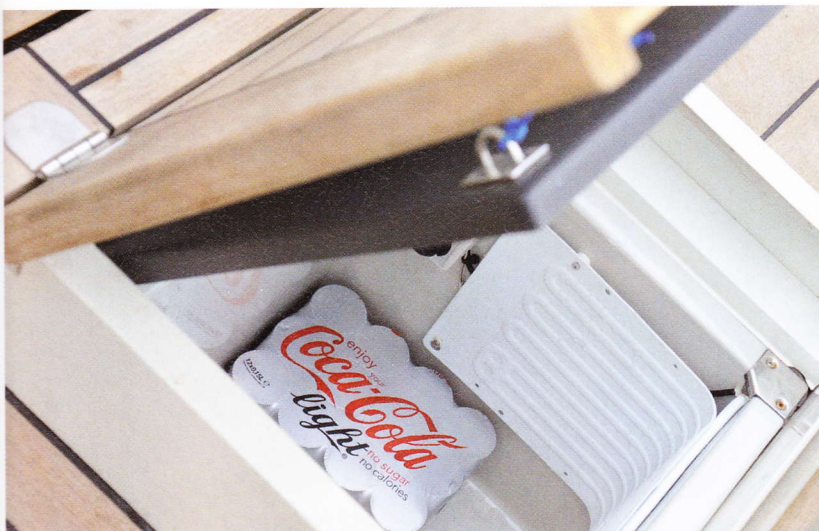
In de vloer is een koelkast ingebouwd.