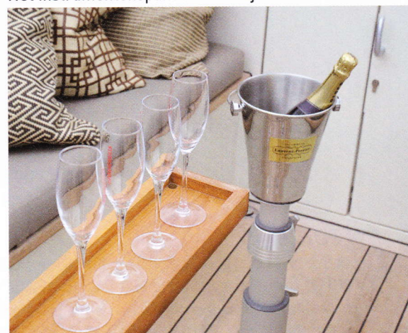
Zet de champagne maar koud, want dat wordt genieten.